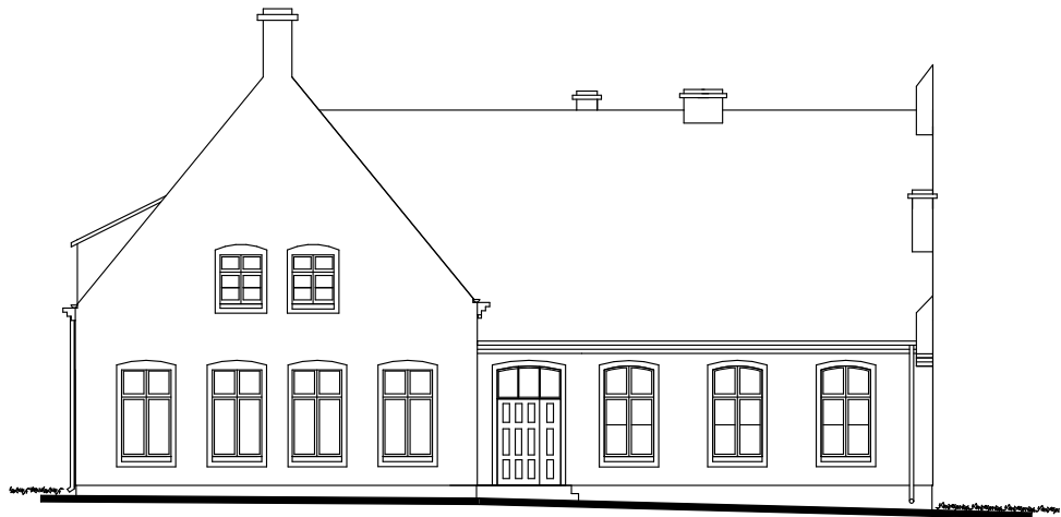
ELEWACJA ZACHODNIA 1:100