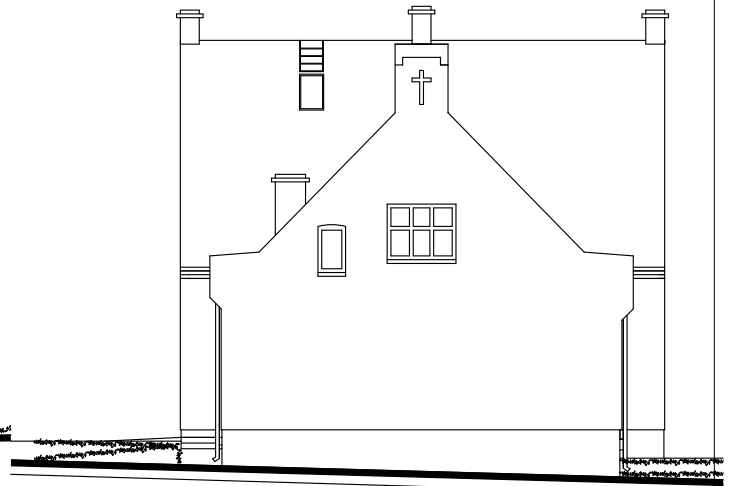
ELEWACJA POŁUDNIOWA 1:100