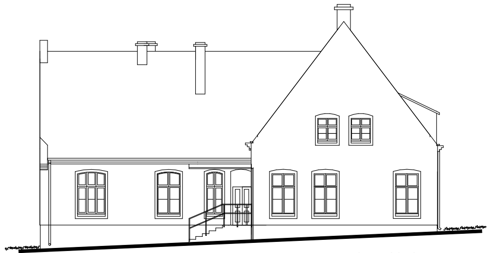
ELEWACJA WSCHODNIA 1:100